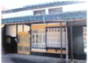
糸島市志摩岐志745番地